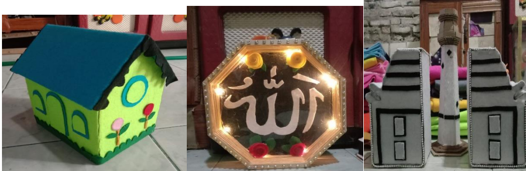
Gambar 1. Foto Produk Mitra